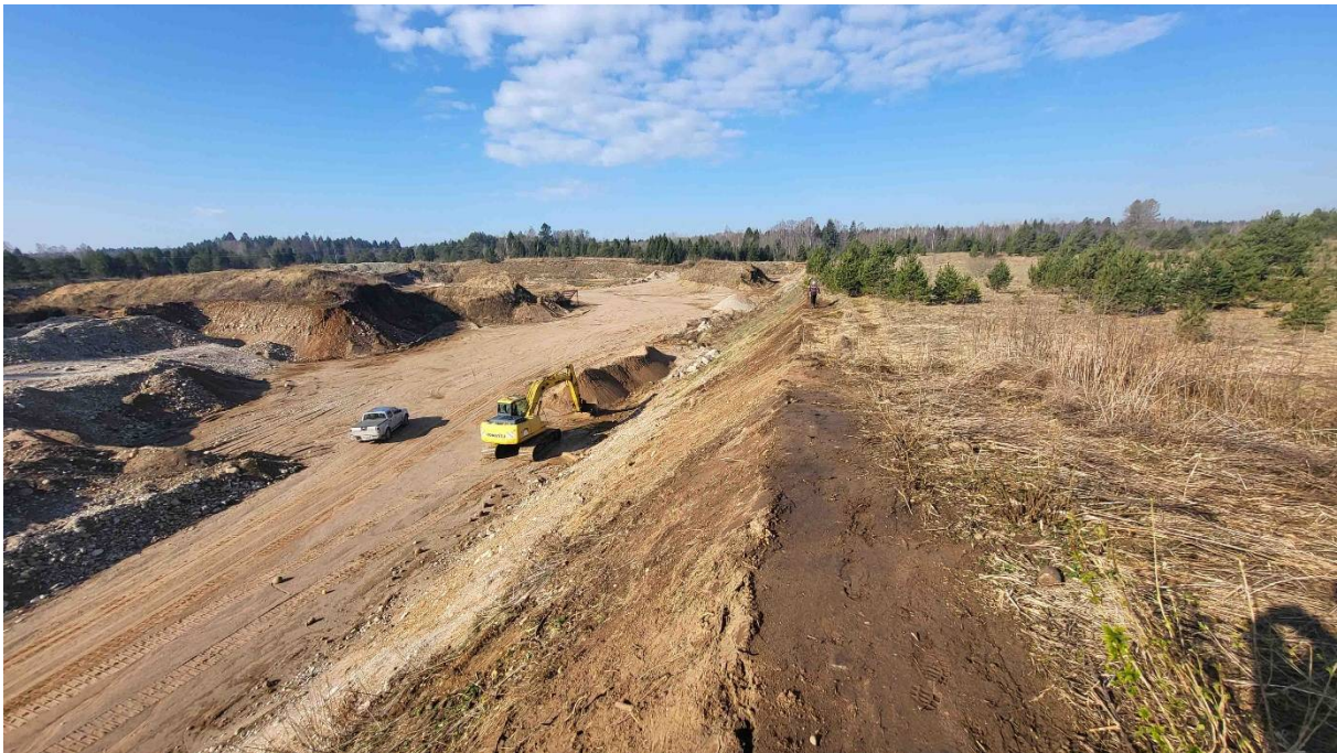
Foto 1. Männikvälja karjääri kesk-põhja-lääneosa kaeveala vaatega edela suunas.

Ülevaade mäeeraldise seisundist on esitatud fotodel 1–4 (seisuga 2026 aprill).