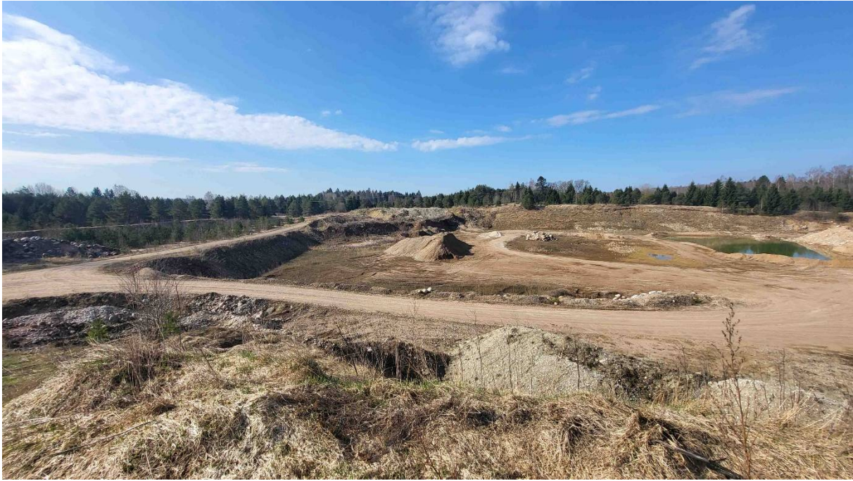
Foto 4. Männikvälja karjääri kesk-lääne-lõunaosa kaeveala vaatega edela suunas.