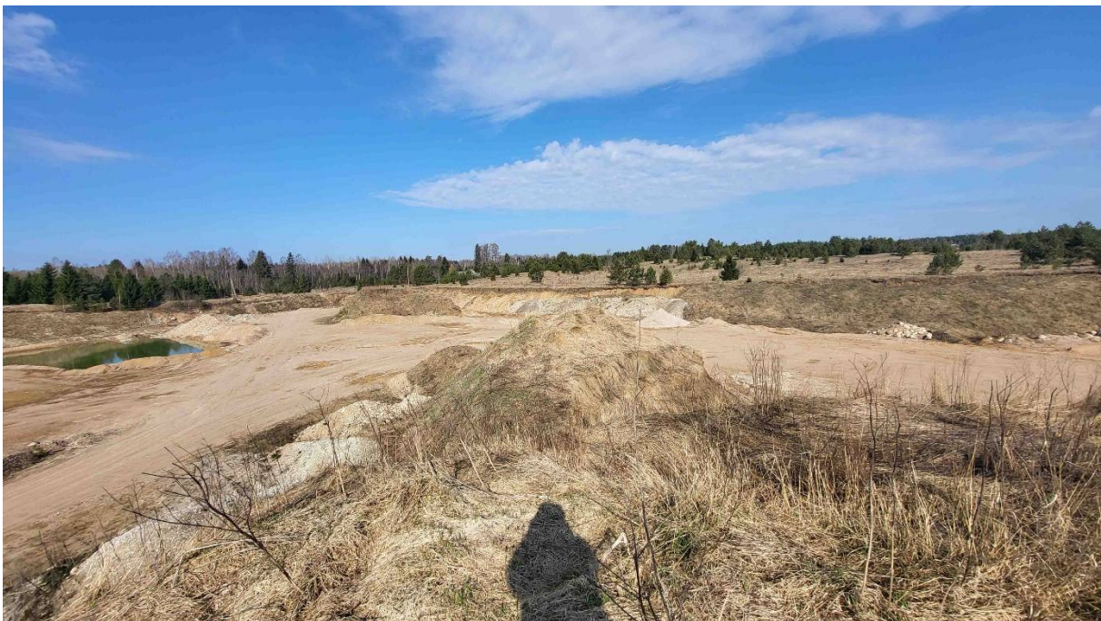
Foto 3. Männikvälja karjääri kesk-lääne-põhjaosa kaeveala vaatega loode suunas.