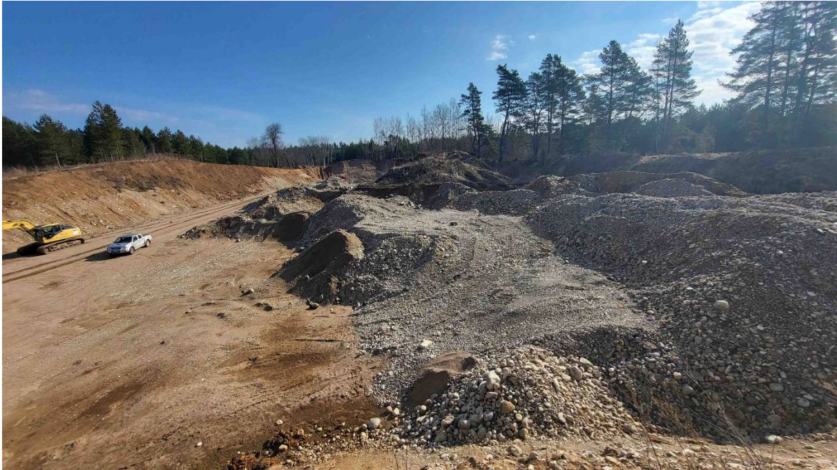
Foto 2. Männikvälja karjääri kesk-ida-põhjaosa kaeveala vaatega kirde suunas.